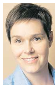
Eva-Maria Kröger Die Linke

„Ich gehe davon aus, dass wir deutlich wachsen werden. Und klar ist auch, dass wir zu wenig Wohnraum haben. Es kommt jetzt auf eine Verdichtung des Wohnraums an.“