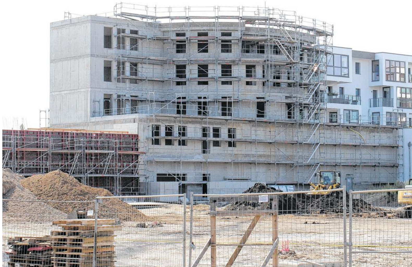
Mehr teure Wohnbebauung befürchten Bürgerinitiativen in Warnemünde. Wird dafür die Bevölkerungsprognose politisch genutzt? Jetzt hat sich ein Fachmann mit dem Zahlenwerk befasst.

Rückblickend erkennt das Netzwerk an, dass ein Zuzug durch Flüchtlinge hätte entstehen können, wie es in der Bevölkerungsprognose festgehalten ist. Nun