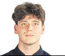
VON LUKAS FÜRSTENBERG