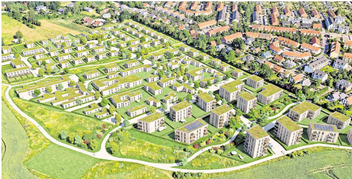
So soll das neue Wohngebiet aussehen, das die Ostseesparkasse am Rand der Hansestadt baut. VISUALISIERUNG: OSTSEESPARKASSE / ARCHITEKT TILO RIES

Die Erschließung werde gemeinsam mit der Gemeinde Papendorf und für das ganze Gebiet auf einmal realisiert. „Erstens wegen der gemeinsamen Wärmeversorgung. Und dann auch deshalb, weil niemand lange auf einer Großbaustelle leben möchte“, so Horn.