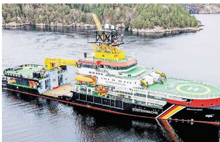
Das Mehrzweckschiff „Scharhorn“ wird heute getauft. Der Bundesverkehrsminister ist in Warnemünde zu Gast.

Die Generaldirektion Wasserstraßen und Schifffahrt (GDWS) und das Wasserstraßen- und Schifffahrtsamt (WSA) Ostsee haben dafür zum Taufakt geladen. Veranstaltungsort ist das Terminal 8 am Passagierkai 3 in Rostock-Warnemünde. Die OZ wird die Veranstaltung mit einem Liveticker begleiten.