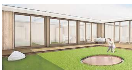
Der Rostocker Architekt Tilo Ries hat sich mit diesem Entwurf am Wettbewerb der Ospa beteiligt. VISUALISIERUNG: TILO RIES/CLG

Geplant seien 20 Grundstücke für Einfamilien- sowie weitere 20 für Doppelhäuser. „Die verkaufen wir bauträgerfrei“, sagt Pannwitt. Ein weiteres Baufeld ist für eine Art Reihenhäuser vorgesehen. „Das Besondere ist dabei, dass wir dort trotz des minimalen Abstandes zwischen den Häusern die maximale Privatsphäre schaffen wollen. Zum Beispiel mit einem uneinsehbaren Garten“, so Horn.